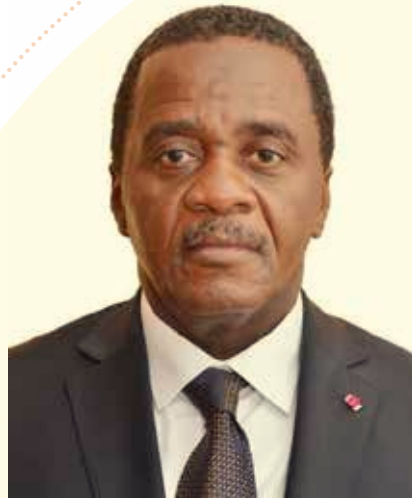
Honorable Gaston KOMBA

C rée en 1987 et Légalisée en 1989, la Cameroon National Association for Family Welfare (CAMNAFAW) est la première organisation de la Société Civile de Santé de la Reproduction au Cameroun. Depuis 2004 elle est une Organisation Non Gouvernementale (ONG) à but non lucratif qui fournit aux populations pauvres des prestations de services de qualité en Santé Sexuelle et Reproductive ainsi que des droits y afférent. Grâce à ses Centres d'Information et d'Education des Jeunes, ses Centres Médicaux et « formations sanitaires franchisées » la CAMNAFAW intervient dans l'information, la promotion et l'offre de services de Santé Sexuelle et Reproductive, notamment dans :